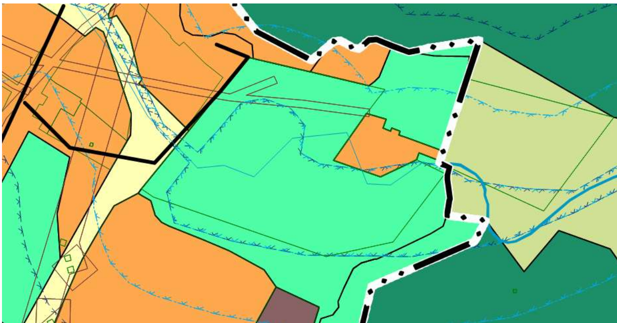
Рис. 1.1 Фрагмент «Карты границ территориальных зон»

В редакции действующих правил землепользования и застройки